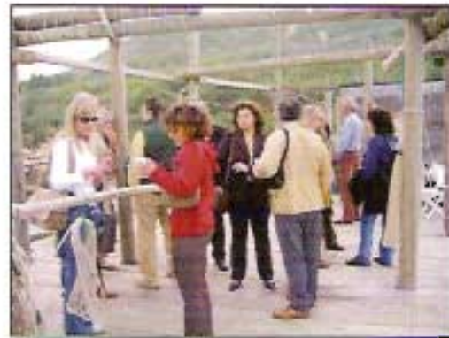
Primer encuentro de profesores. Proyecto COMENIUS. Lanciano (Italia), Noviembre 2004